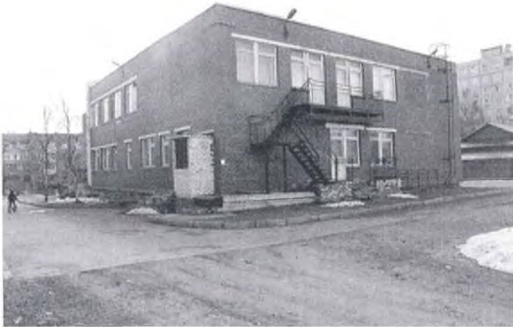
Фото № 2: Входная группа